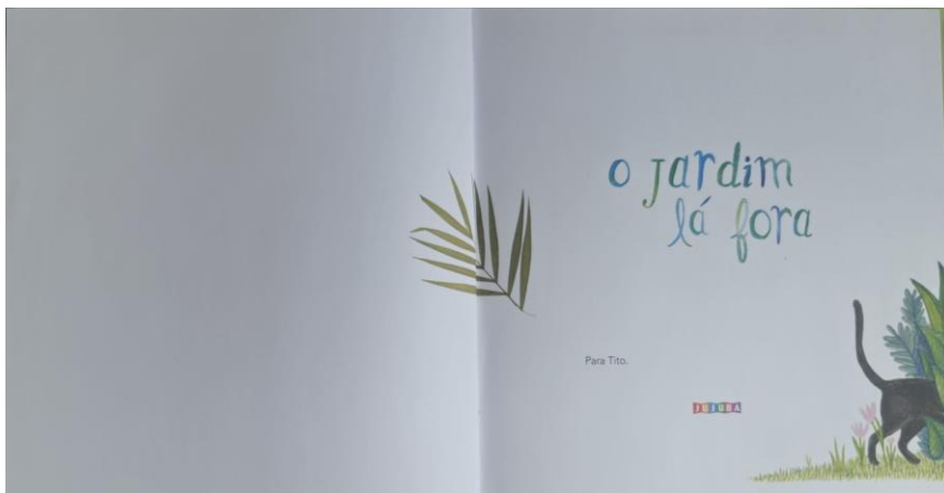
Figura 8. Folha de rosto

Na folha de rosto (Fig. 8), surge um novo personagem: um felino, um gato preto, que aparece de forma discreta, com metade de seu corpo visível, enquanto a outra metade está oculta entre folhagens, como se estivesse explorando o jardim. Esses elementos, representados nas margens do livro, como uma vinheta, provocam no leitor a sensação de continuidade, sugerindo que o gato está em processo de descoberta do jardim ao longo das páginas subsequentes da obra.