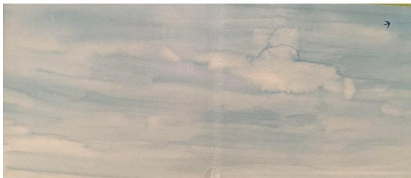
Figura 7. Folha de guarda final

Ao abriremos o livro nos deparamos com a folha de guarda (Fig. 6), ali temos apenas uma página toda com régua de madeira indicando ser uma janela fechada. Em tonalidade azul escuro, sem nenhum outro elemento, o que contapõe a imagem da capa, construindo de acordo Ramos, Furtado e Valentin (2021) novos movimentos interrogativos que possibilitam mobilizariam o leitor a construir e a reconstruir a narrativa.