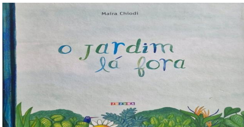
Figura 5. Imagem da capa do livro