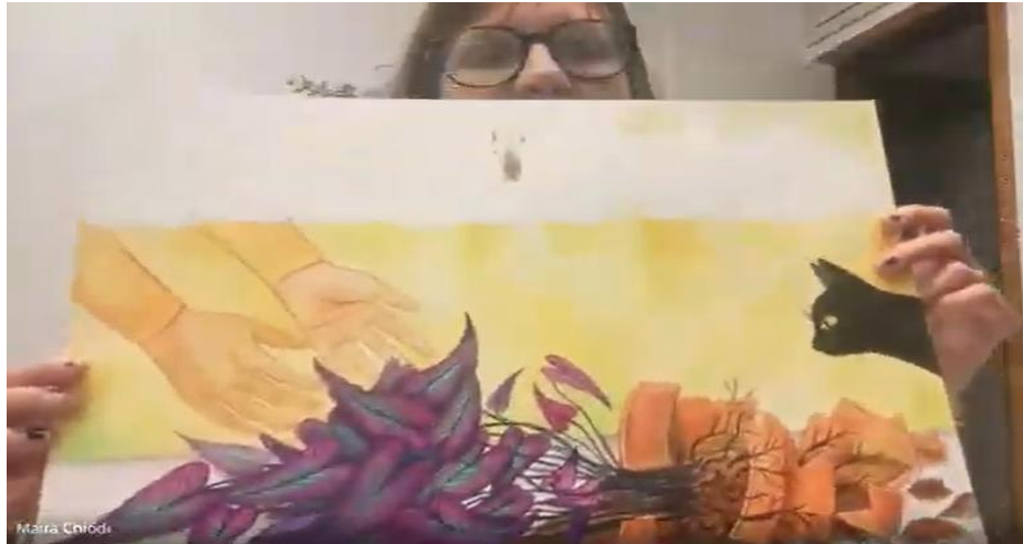
Figura 3. Imagem do rascunho da ilustração