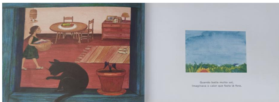
Figura 9. Miolo do livro