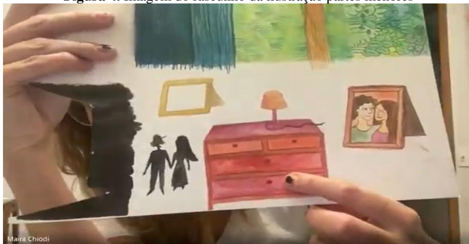
Figura 4. Imagem do rascunho da ilustração partes menores