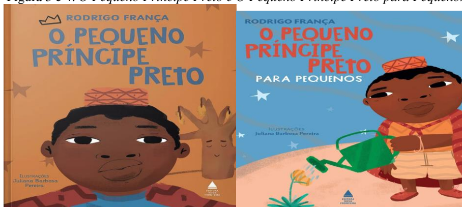
Figura 3 e 4: O Pequeno Príncipe Preto e O Pequeno Príncipe Preto para Pequenos

As rimas e as próprias disposições dos elementos nas páginas dão a impressão de que o autor quis trazer a musicalidade do rap para a obra. Há também uma versão animada do livro disponível no YouTube, narrada pelo Emicida, que pode ser acessada no link < https://www.youtube.com/watch?v=Avt7s8XgDjs >. Acesso em: 22 jun. 2025.